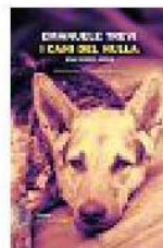
EMANUELE TREVI I CANI DEL NULLA (Einaudi)

Un giovane fotografo nel soffocante abbraccio di una famiglia di viaggiatori e (velatamente) della storia argentina