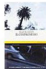
ELIA KAZAN IL COMPROMESSO (Mattioli 1885)

A metà tra saga famigliare e noir claustrofobico, un rompicapo con al centro una neonata e una zampa di coniglio