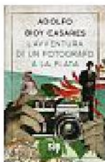
A. BIOY CASARES L'AVVENTURA DI UN FOTOGRAFO A LA PLATA (Sur)

Un giovane fotografo nel soffocante abbraccio di una famiglia di viaggiatori e (velatamente) della storia argentina